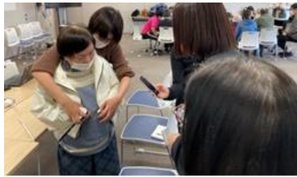
ファスナーの開け閉め作業を 当事者に体験いただく