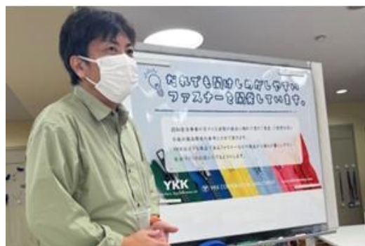
施設訪問時に ファスナーを説明

大阪市や鳥取市のデイサービスやグループホーム、認知症当事者が集まり自らの体験や必要としていることを語り合う場である本人ミーティングに、YKKファスニング商品がついている衣服や雑貨を持って訪問し、日々の暮らしにおけるファスナーの開け閉め作業で感じているストレスなどヒアリングを行いました。